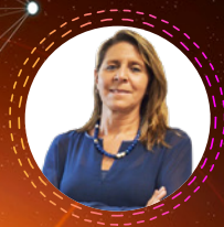
María Victoria Riaño

Presidenta Ejecutiva del Consejo Colombiano de Seguridad desde abril de 2017, donde se ha destacado por su liderazgo participativo en la construcción de la cultura de la prevención de riesgos del país, logrando fortalecer el camino estratégico de la entidad mediante el desarrollo de iniciativas y alianzas técnicas que promueven la implementación de las mejores prácticas que permiten transformar nuestro país hacia un ambiente laboral seguro y saludable.